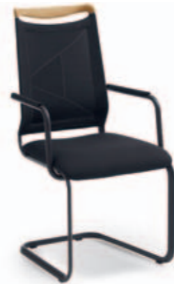
Sessel LILLI PLUS